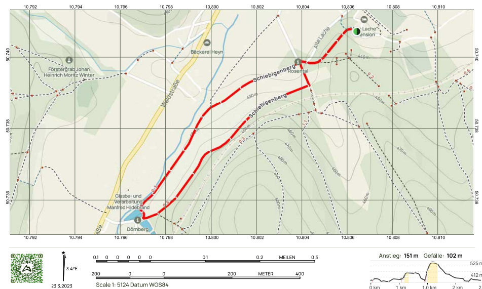
Kinderlauf Waldfest 2 km