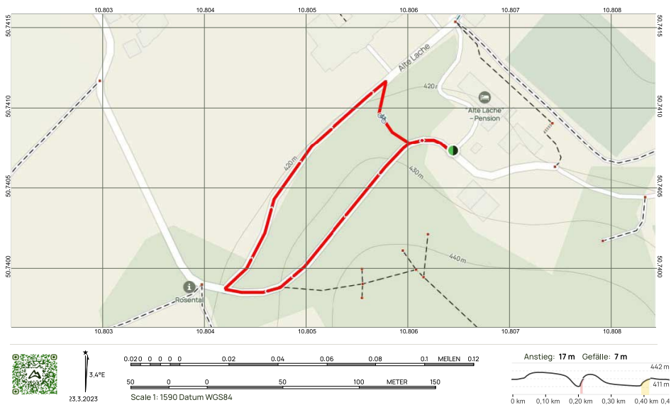
Bambinilauf Waldfest 480 m