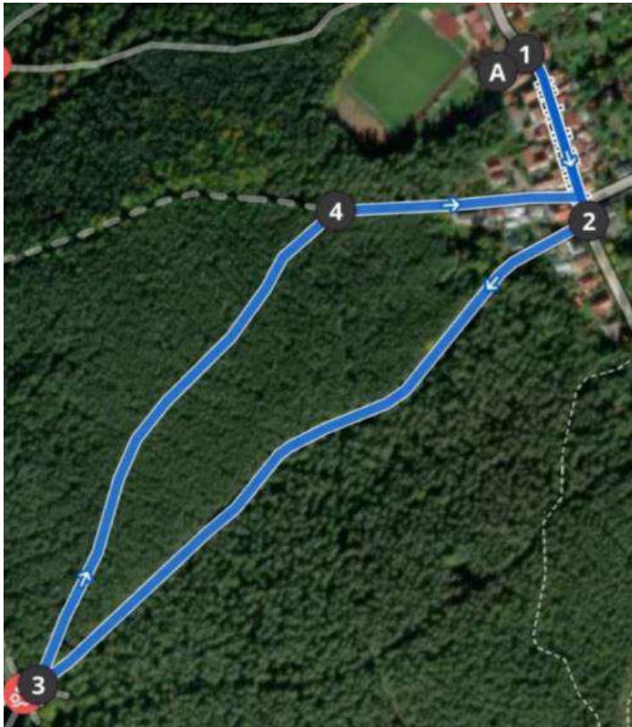
Streckenverlauf 2 km Strecke (Kinderlauf), Höhenangabe: 20 m Aufstieg